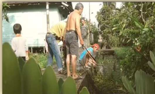
Gambar : Kegiatan Lingkungan