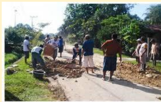
Gambar : Kerja Bakti Masyarakat

Ket. LPKD Kelompok dibagi dengan diacak setiap kelompok mendapatkan 1 gambar kasus