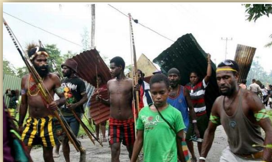
Gambar : Perang Antar Suku