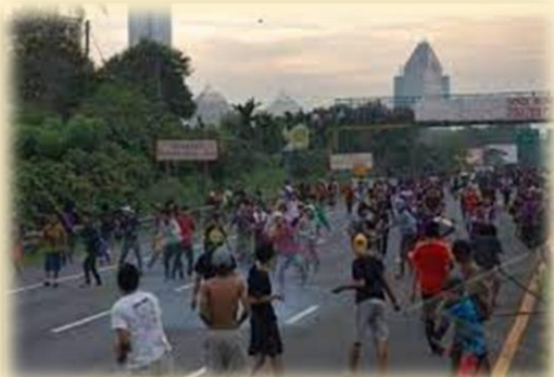
Gambar : Tawuran antar kelompok