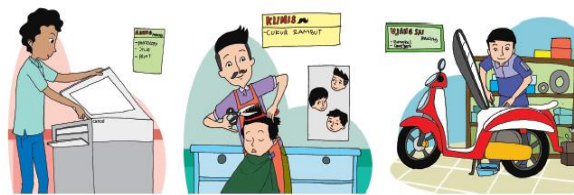
(Buku siswa, halaman 63)