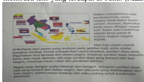
(Buku siswa, halaman 66)