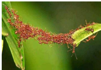
Gbr 1 ( ada 569 semut)