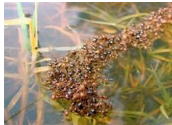
Gbr 2 ( ada 231 semut)