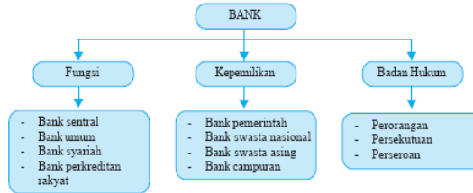
Skema 10.1 Jenis-Jenis Bank