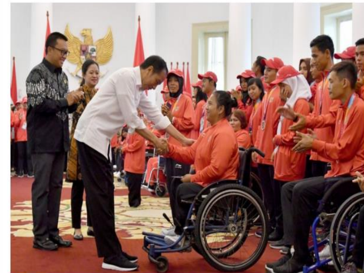
President Joko Widodo (center) shakes hand with a member of Team Indonesia in the 2018 Asian Para Games after handing out cash bonuses at Bogor Palace in West Java on Saturday. The bonus is ranging from Rp 100 million (US$6,576) to Rp 1.5 billion.

http://www.thejakartapost.com/news/2018/10/13/jokowi-hands-out-cash-bonuses-to-asian-para-games-medalists.html