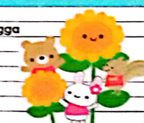
Model Pembelajaran berbasis STEAM dengan media Loose Part