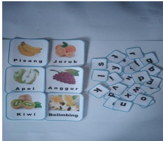
Kartu gambar buah dan kartu angka