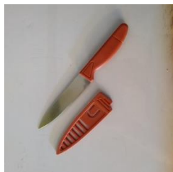
pisau (pengawasan guru),