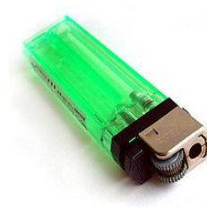
korek api (Pengawasan guru)