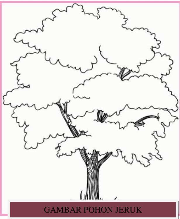
GAMBAR POHON JERUK