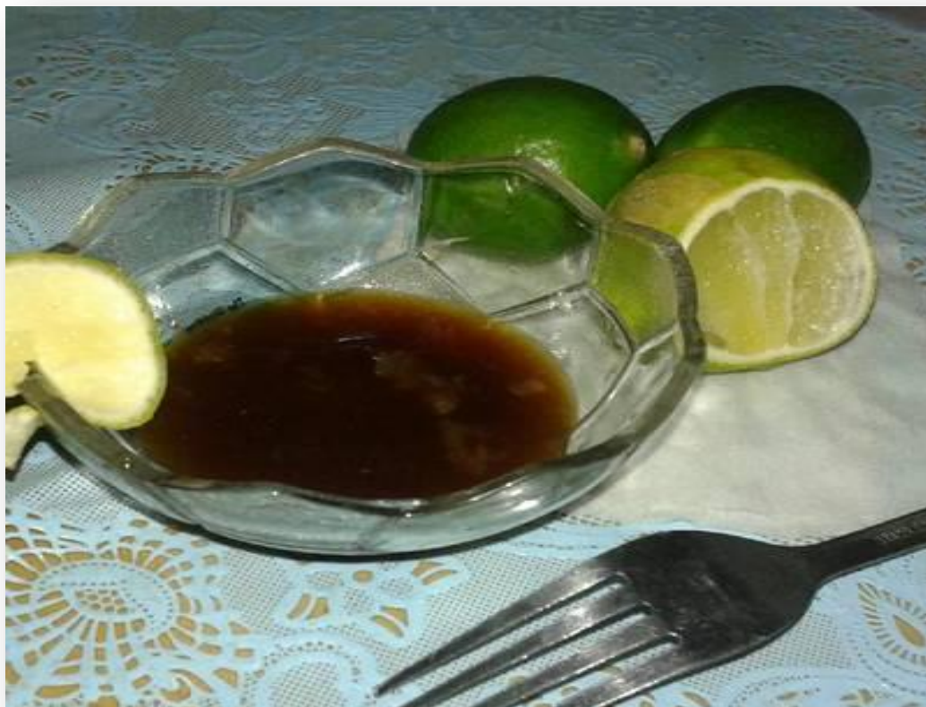
HASIL DARI PENCAMPURAN JERUK NIPIS DAN KECAP