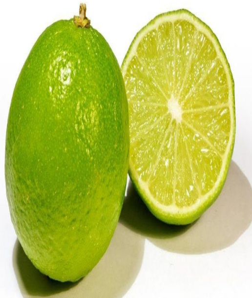
BUAH JERUK NIPIS DI BELAH JADI DUA