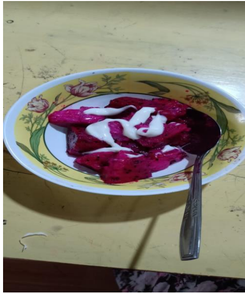
HASIL DARI MEMBUAT SALAD DARI BUAH NAGA