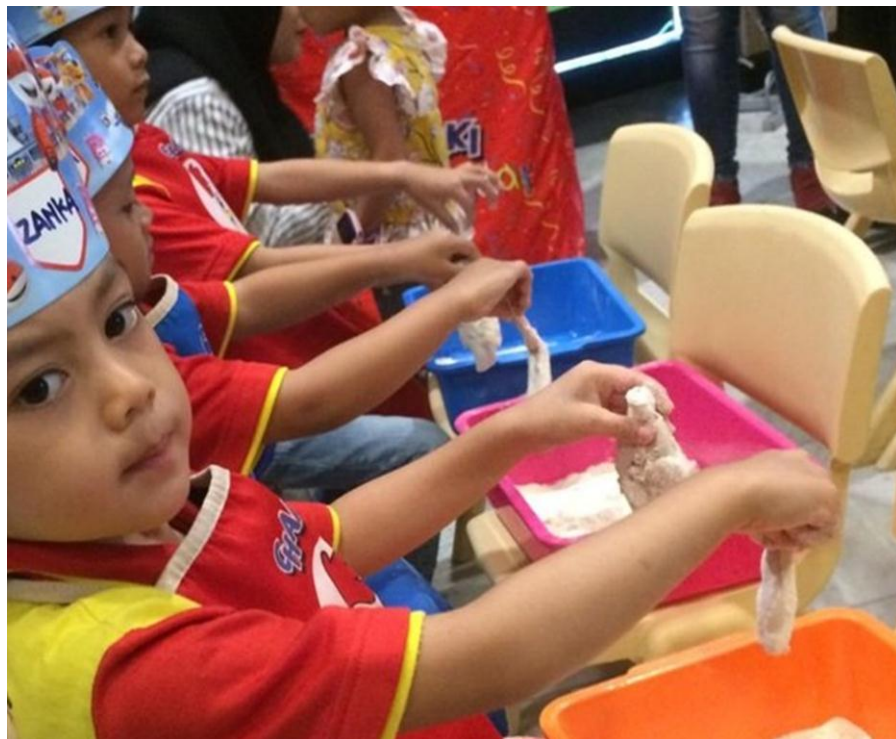
Kegiatan membuat ayam goreng bersama ibu