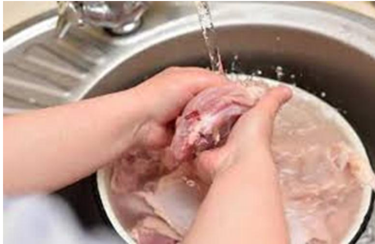
Kegiatan mencuci ayam untuk pengembangan motoric halus anak

Nama ( Anak menulis namanya sendiri ) : ..... Hari/Tanggal : Senin/ 26 Oktober 2020 Kelompok : B Kegiatan : Ayo tempelkan foto hasil Praktik membuat ayam goreng di rumah dan kegiatan Mampu mencuci daging ayam yang akan di masak