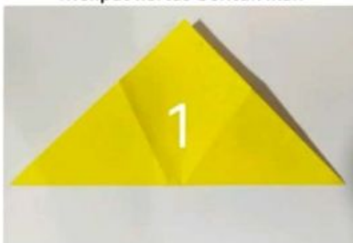
Melipat kertas bentuk ikan

Tingkat pencapaian perkembangan anak: Melakukan eksplorasi dengan berbagai media dan kegiatan (FM-Motorik halus)