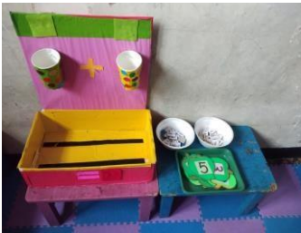
Lihat aku bisa berhitung ! Gelas pintar, gambar udang dan bandeng, , lambang bilangan