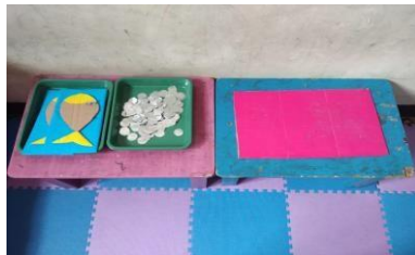
Berkreasi membuat ikan bandeng Pola gambar ikan bandeng, kertas alumunium foil, lem, spidol