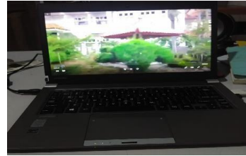
Laptop Video tentang kebudayaan Sidoarjo