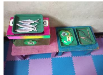
Mengukur panjang bandeng yuk ! Bandeng, pita, lambang bilangan