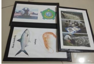
Poster Bercakap-cakap tentang kebudayaan Sidoarjo