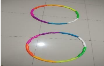
Simpai Melompat ke dalam simpai