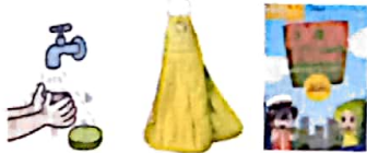
Air sabun kain lap buku do'a