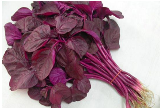
2. Bayam ungu