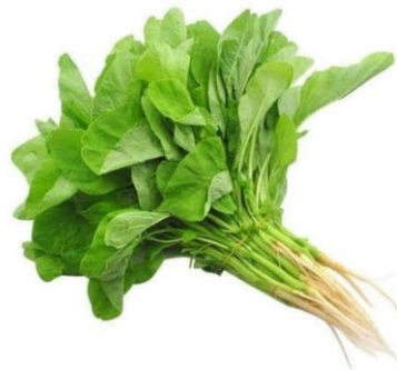
1. Bayam hijau