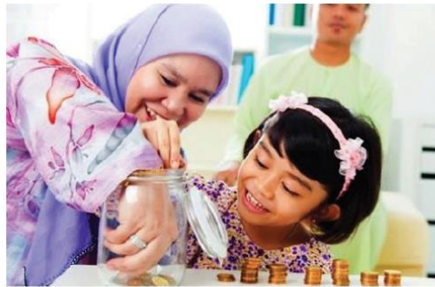
Interaksi antar individu, seorang ibu dengan anaknya