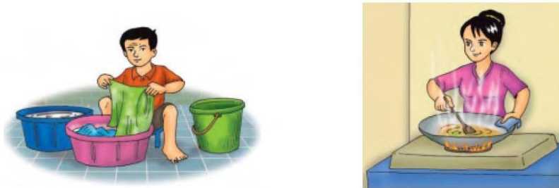
Gambar 11.1 Beberapa kegunaan air dalam kehidupan sehari-hari

Sebagian tubuh kita terdiri dari air. Apabila tidak minum air selain kehausan, tubuh kitapun menjadi lemas. Banyak sekali kegunaan air dalam kehidupan. Oleh karena itu, kita perlu menggunakan air dengan sebaik-baiknya. Air yang kita gunakan dalam kehidupan sehari-hari berasal dari suatu proses yang cukup panjang yang disebut daur air.