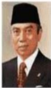
Adam Malik (Indonesia)