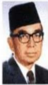
Tun Abdul Razak (Malaysia)