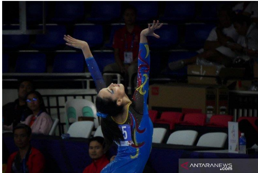
Gambar 1 Senam Lantai

Senam lantai adalah salah satu jenis olahraga yang dilakukan dengan gerakan di lantai dan menggunakan matras sebagai alasnya. Senam berasal dari kata “gymnastic” yang dilakukan di ruang khusus dengan memadukan performa gerak, kekuatan, kecepatan, dan gerak yang serasi. Matras dalam senam lantai berfungsi sebagai alat bantu utama dalam mengurangi resiko terjadinya cedera. Hal ini karena gerakan senam lantai banyak bersentuhan dengan lantai, seperti berguling, melompat hingga meloncat.