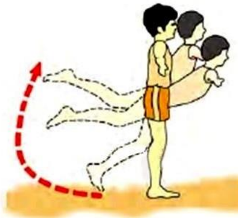
Gambar 3 Tahapan sikap kapal terbang