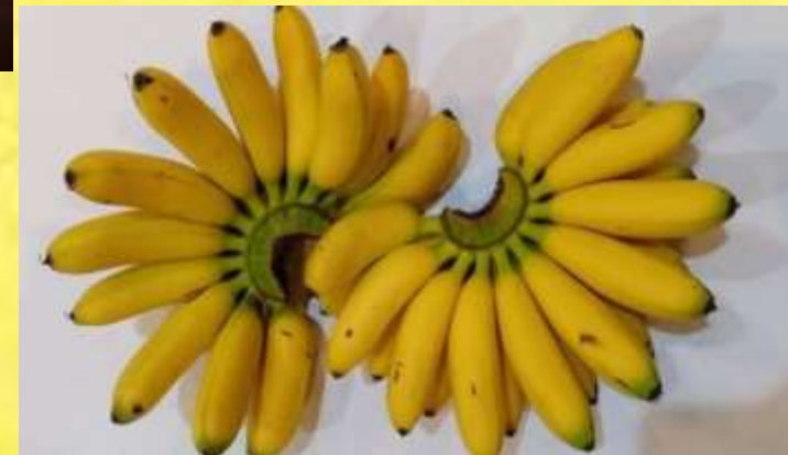
Pisang mas/ pisang 40 hari