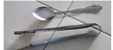
jepit / sendok