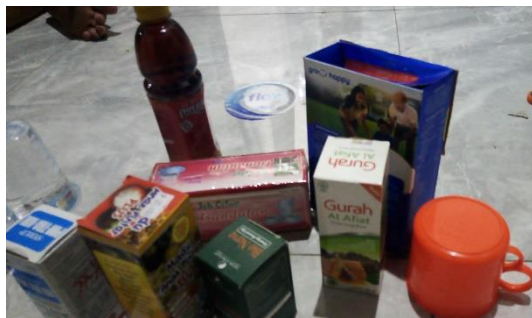
Benda-benda di rumah