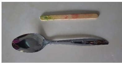
kayu/ sendok untuk pengaduk bahan