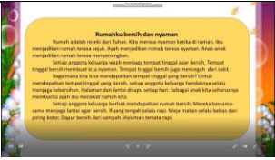
Materi yang diunggah di wa