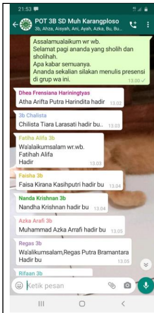
Setting tampilan guru memberi informasi di wa