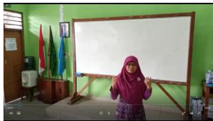
Tampilan video guru membuka pelajaran, menanyakan kabar, mengajak berdoa dan memotivasi siswa dengan mengajak tepuk semangat.