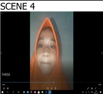
Presentasi siswa, siswa mengirim tugas melalui wa

Narasi : siswa menjawab pertanyaan guru tentang kalimat saran yang ada di teks