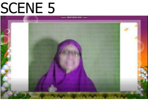
Tampilan layar guru menutup pelajaran

Narasi : Siswa menceritakan pengalamannya melaksanakan kewajiban dan haknya di rumah.