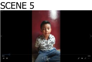
Presentasi tugas bercerita

Narasi : siswa menjawab pertanyaan guru tentang kalimat saran yang ada di teks