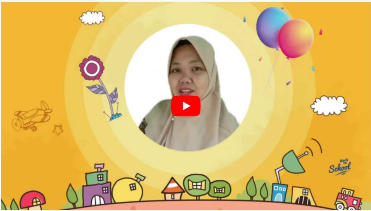
#berbagi Video Praktik Pembelajaran PPG Daljab 2020