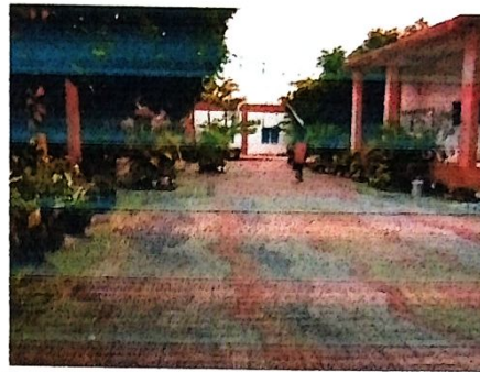
Gambar Lingkungan Sekolah Sesudah dibersihkan