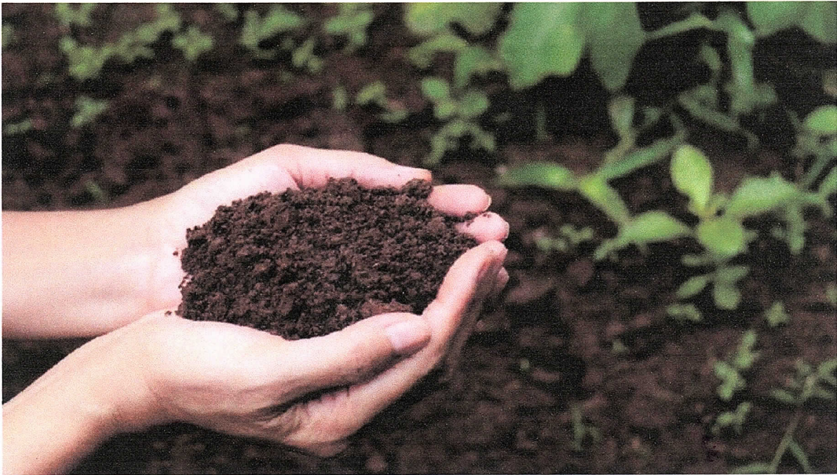
Gambar Pemandangan :