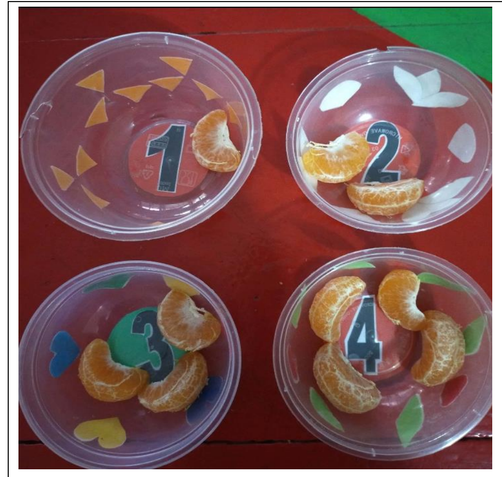
MEMASUKKAN BUAH JERUK KE DALAM MANGKOK SESUAI ANGKA.