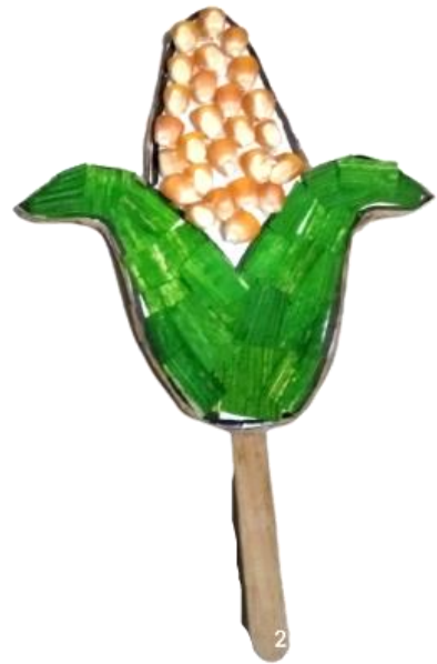
Contoh Hasil Kolase