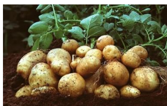
Kelompok tanaman jenis umbi