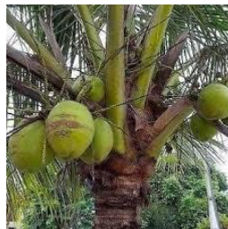
Kelompok tanaman jenis buah