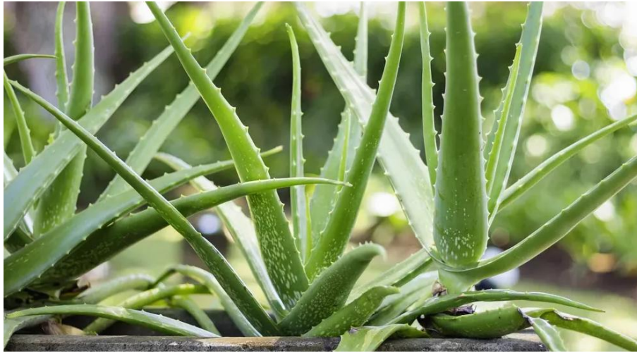
1. Gambar Lidah Buaya

Lembar Kegiatan 1 Membuat Salah satu huruf dari tulisan Lidah Buaya dengan menggunakan daun Kelapa Sawit