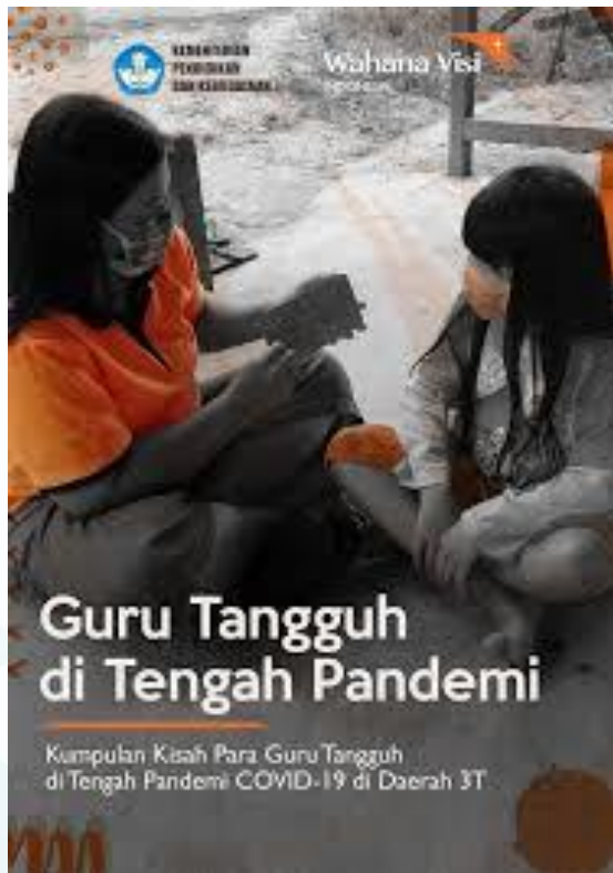
Gambar 3. Ilustrasi

Berdasarkan gambar ilustrasi tersebut, menurut kalian adakah hal-hal yang dapat menggugah perasaan dan membangkitkan motivasi? Dapatkah hal tersebut dijadikan inspirasi dalam kehidupan? Buatlah sebuah cerita berdasarkan ilustrasi di atas! Tulislah di buku catatanmu.