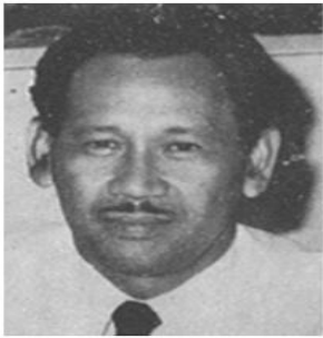
BM Diah