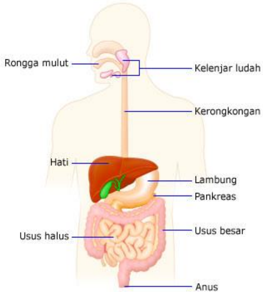
Gambar Sistem Pencernaan Manusia