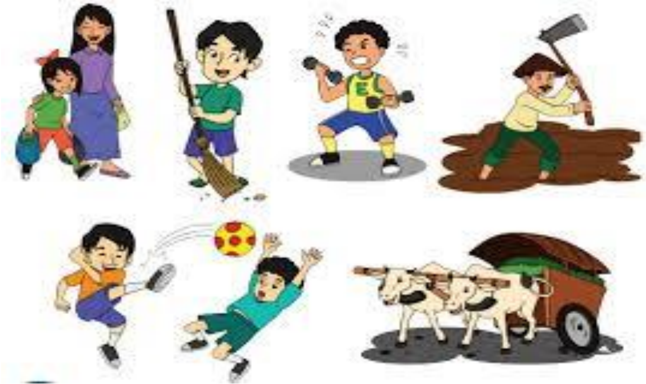
Gambar kegiatan di siang hari 2