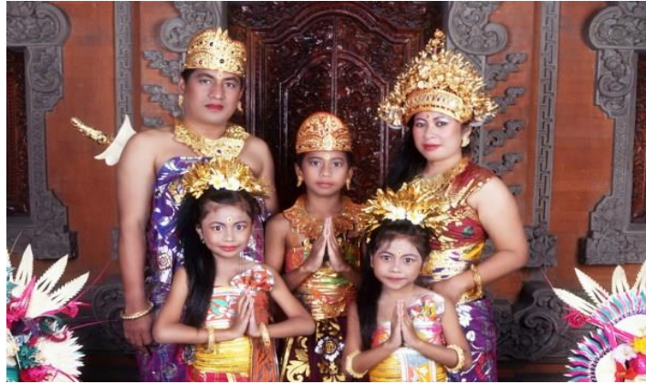
KELUARGA GAYATRI DARI YOGYAKARTA