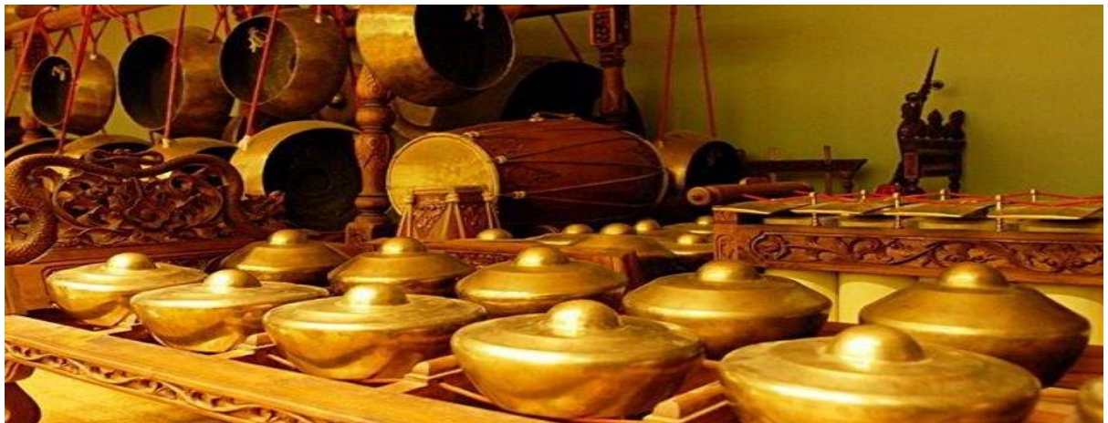
GAMELAN JAWA TENGAH