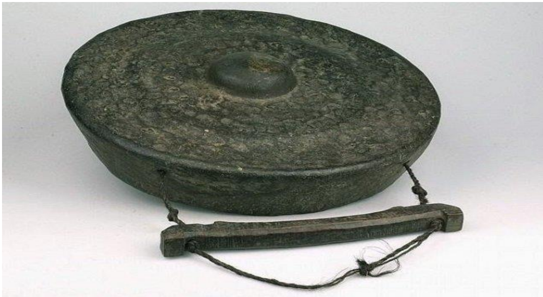
ARAMBA SUMATERA UTARA