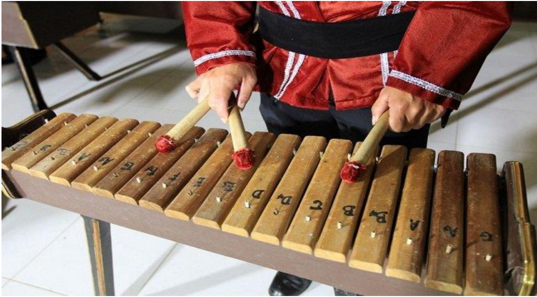
KOLINTANG SULAWESI UTARA