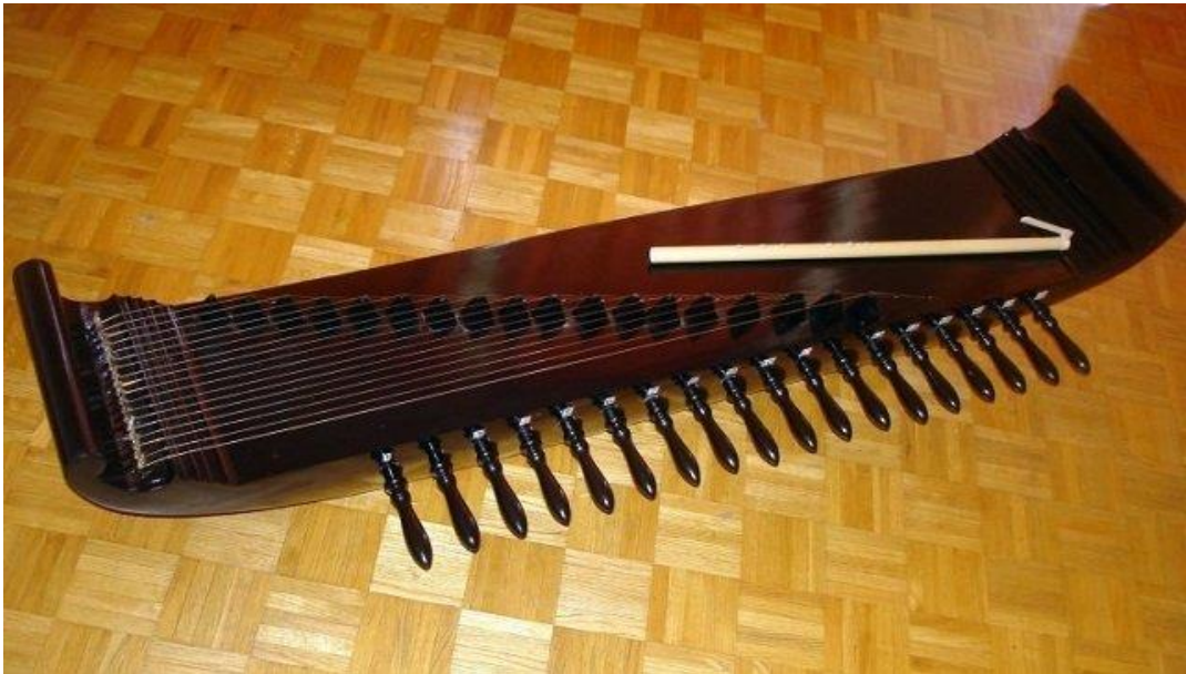
KECAPI SULAWESI BARAT