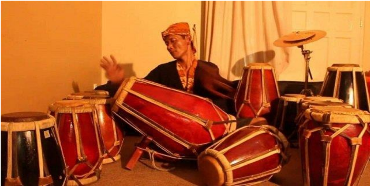
KENDANG DAERAH ISTIMEWA YOGYAKARTA