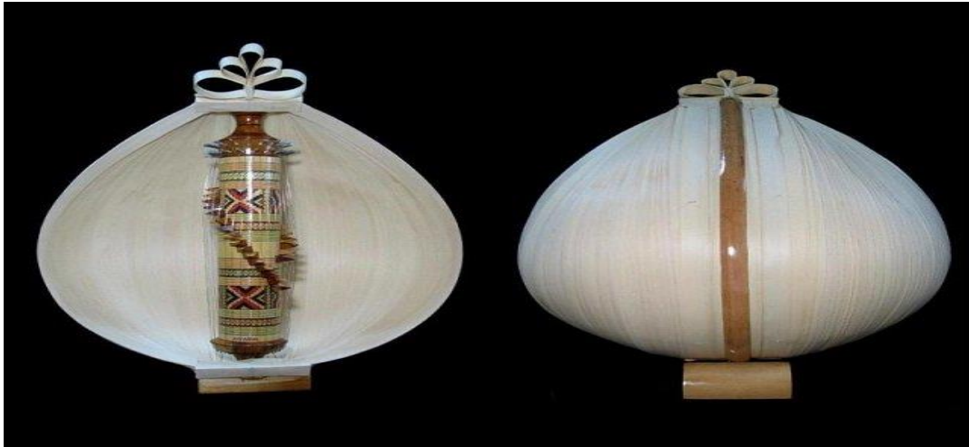
SASANDO NUSA TENGGARA TIMUR