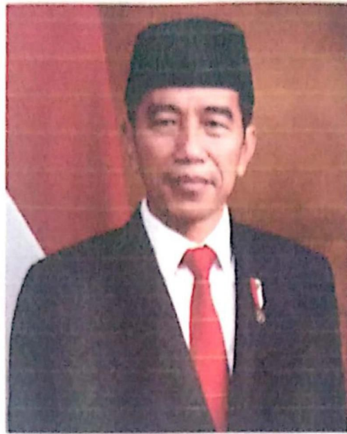
FOTO GUBERNUR JAWA TENGAH