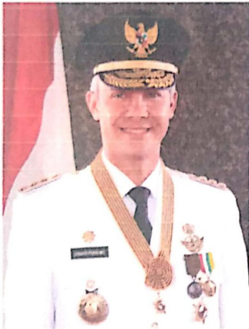
FOTO BUPATI DEMAK