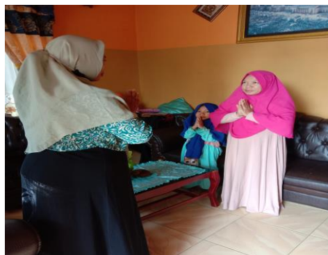
Berpamitan pada orang tua