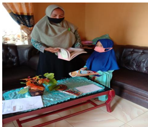
Memberikan tugas membaca