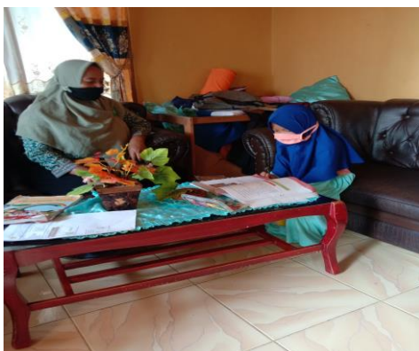
Membaca buku tema