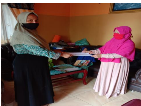
Menyerahkan tugas belajar