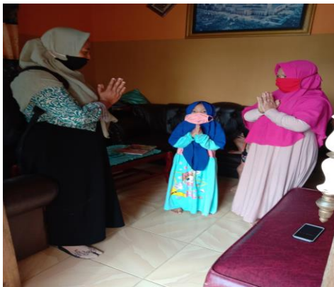
Berpamitan pada orang tua /mengajar