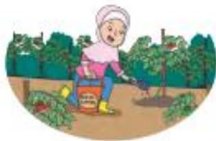
Menaburkan kompos daun di sekitar tanaman. Kompos akan menyimpan air lebih lama.