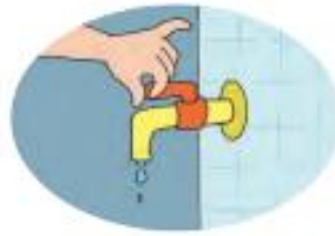
Setelah digunakan, keran air ditutup dengan rapat.