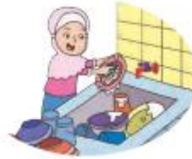
Mematikan keran saat menyabuni piring.

Gambar aturan menjaga dan menghemat air bersih