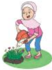
Siti menyiram tanaman menggunakan air bekas cucian beras.