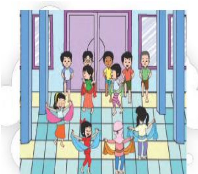
Gambar menari gerakan burung