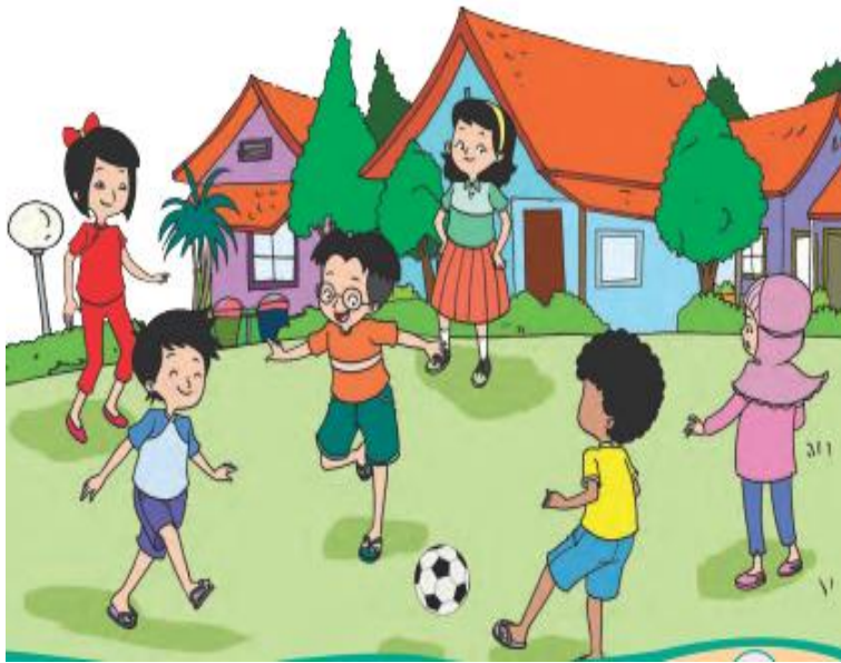
Gambar bermain di musim Kemarau