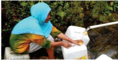
Seorang warga Kelurahan Waborobo, Kecamatan Betisambari sedang mengambil air dari anak aliran sungai.

Warga Kelurahan Waborobo, Kecamatan Betisambari, Kota Baubau, Sulawesi Tenggara sulit mencari air bersih. Mereka harus menempuh perjalanan hingga sejauh 15 kilometer dari tempat tinggalnya untuk mendapatkan air bersih. Mereka terpaksa mengambil air bersih di Kelurahan Kaisabu Baru,