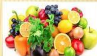
Makanan yang Mengandung Antioksidan dan Lemak Baik. ...