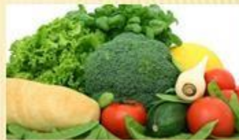
Makanan Tinggi Serat