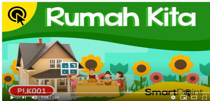
4 Macam Kegunaan Rumah (SmartPoint PLK001)

https://www.youtube.com/watch?v=GNVTAp7anNo