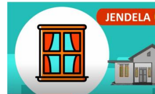
Jendela:keluar masuk Cahaya dan udara