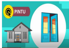
Pintu tempat keluar dan masuk