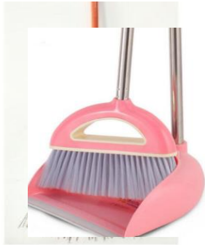
SAPU IJUK DAN PENGKI