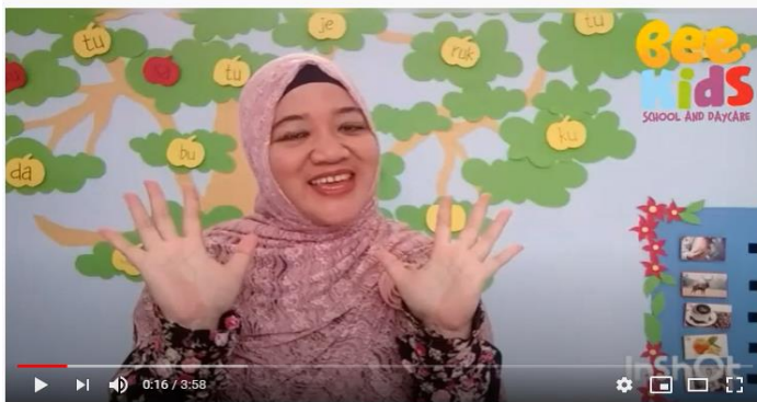
Lagu tema "Rumahku"

https://www.youtube.com/watch?v=60db3XOoZDM