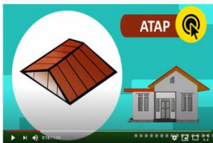
Atap bagian atas rumah