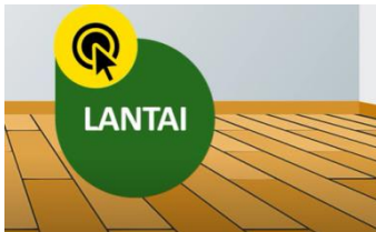
Lantai : bagian bawah rumah