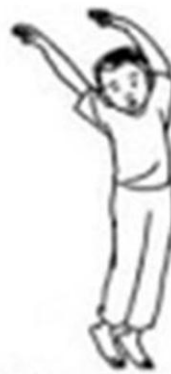
Menjulang ditup angin