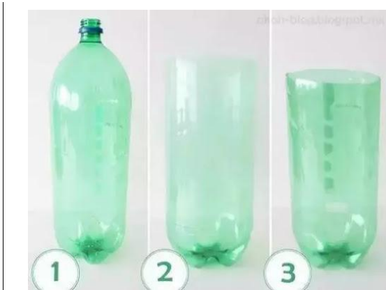
Akua yang belum di gunting

Berikut adalah contoh hasil karya yang akan di buat anak: