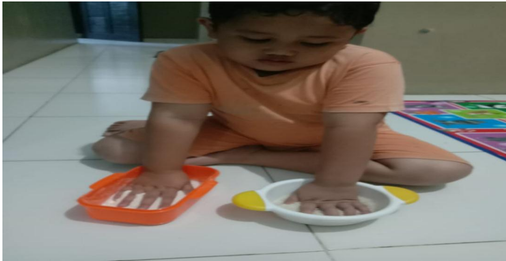
Foto kegiatan sensori motoric mengenal tekstur beras dan terigu