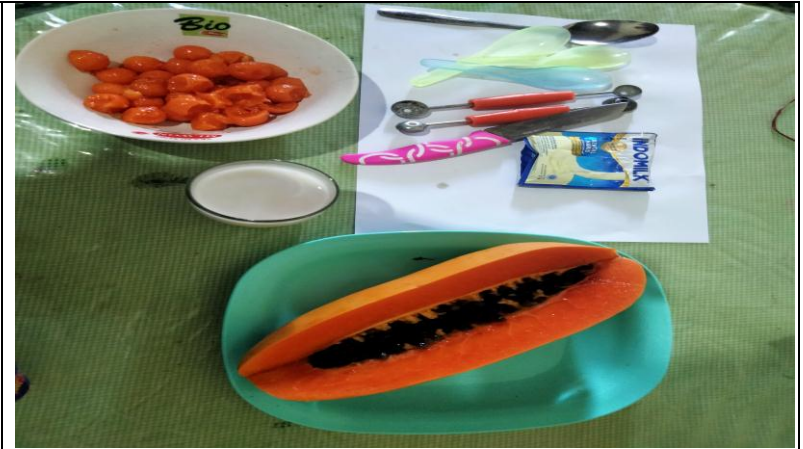
FOTO MERONC E KALUNG