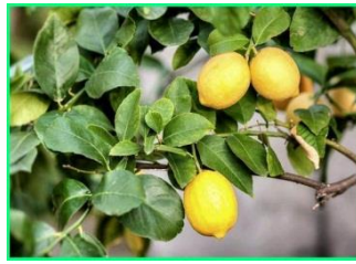
Jeruk Lemon/ Jeruk Sitrun