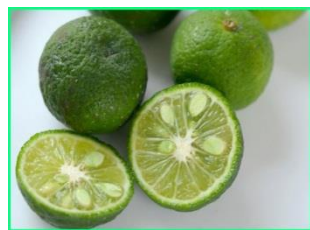
Jeruk Limau/ Jeruk Sambal