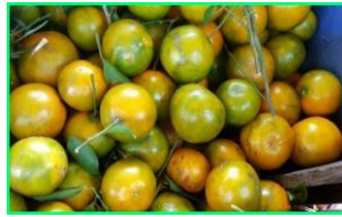
Jeruk Pontianak/ Jeruk siam