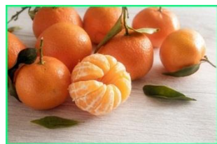
Jeruk Mandarin yang manis