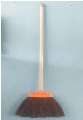
4. Sapu ijuk