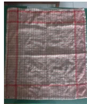
6. Kain lap