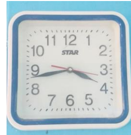
3. Jam dinding