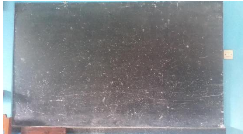
2. Papan tulis hitam