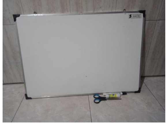
ALAT TULIS & PAPAN WHITE BOARD