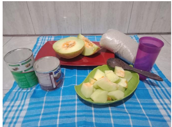
BAHAN JUS BUAH MELON