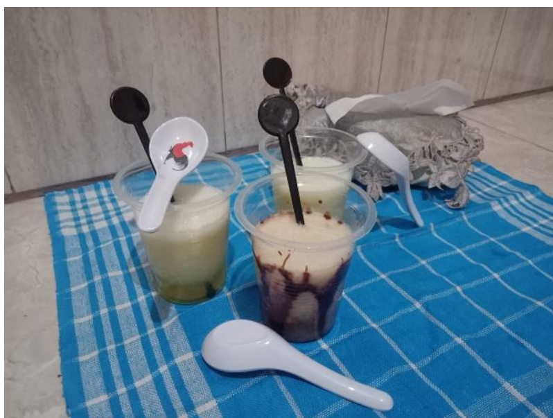
VARIAN JUS BUAH MELON