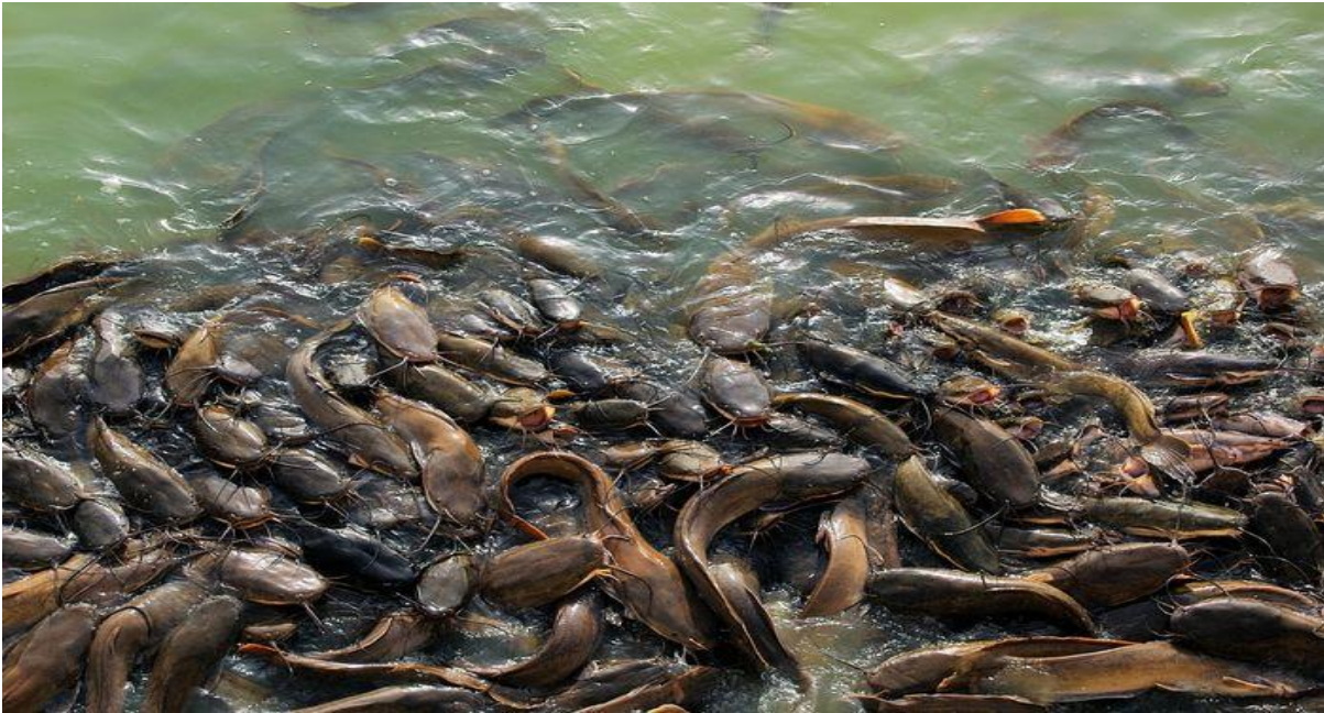
Ikan lele atau sering disebut catfish

Lele adalah salah satu jenis ikan yang bisa diolah menjadi makanan.