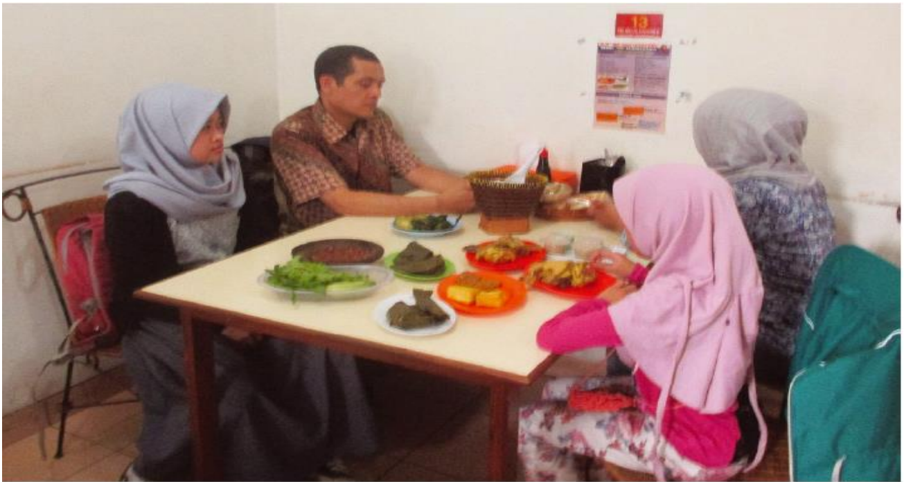
Gambar 3.6. Orang sedang makan di restoran sebagai kegiatan konsumsi