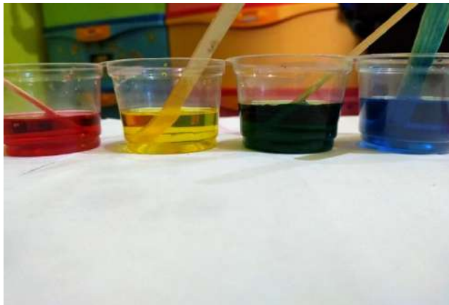
AIR DICAMPUR PEWARNA KUE DAN GULA DENGAN TAKARAN YANG BERBEDA