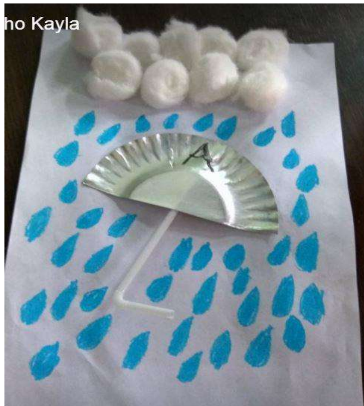
KREASI PAYUNG DARI SEDOTAN DAN PIRING KERTAS