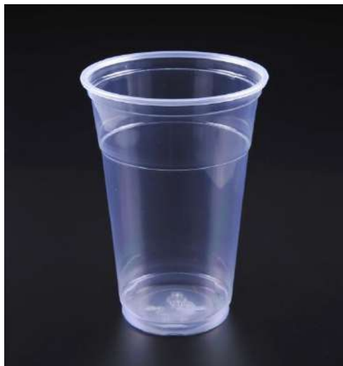
1 GELAS PLASTIK BESAR