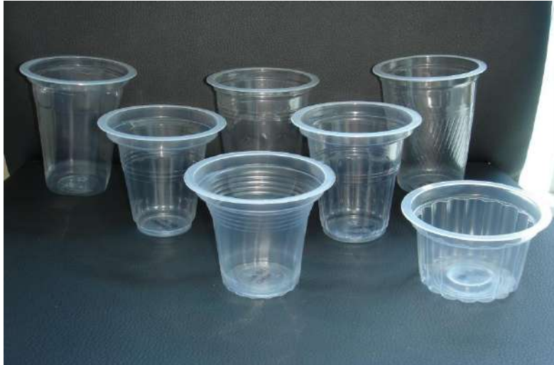
4-5 GELAS PLASTIK KECIL