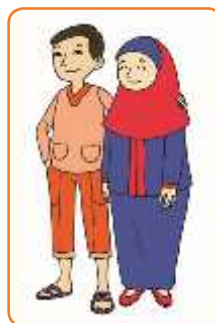
Ayah dan Ibu