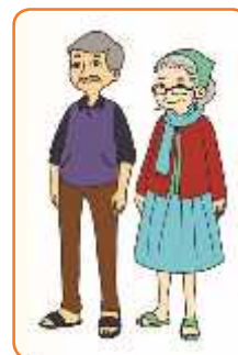
Kakek dan Nenek